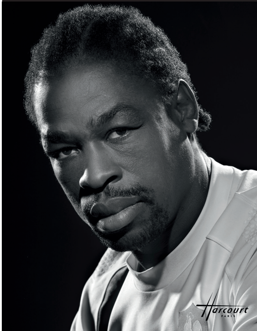
Serge Betsen 2007

Les deux boxeurs et Serge Betsen, autre athlète clichois, sont mis à l'honneur dans cette exposition et leurs portraits s'affichent aux côtés d'autres grands noms du sport tels que Teddy Riner, Rafael Nadal ou encore Florence Arthaud.