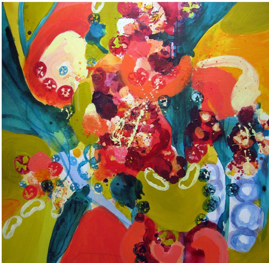
Promesses d'Automne