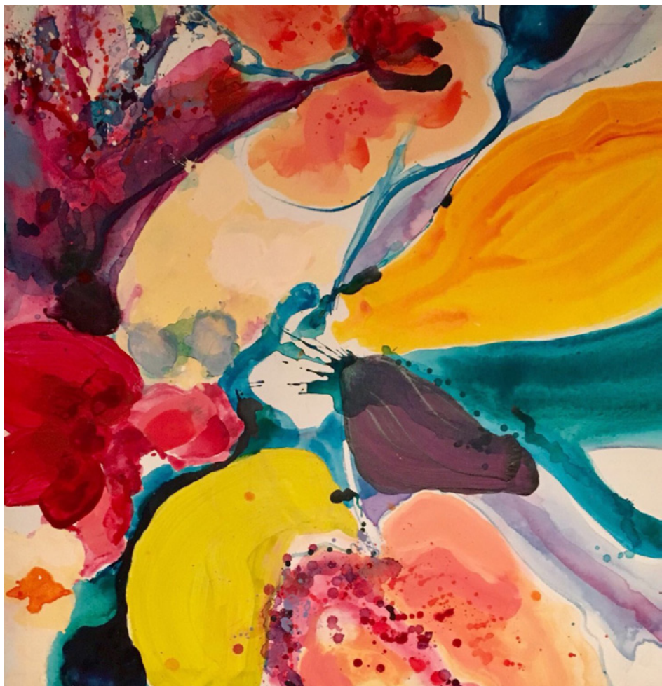
Vacance © Anja Hagemann