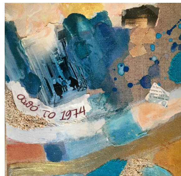
Koufonisia 2