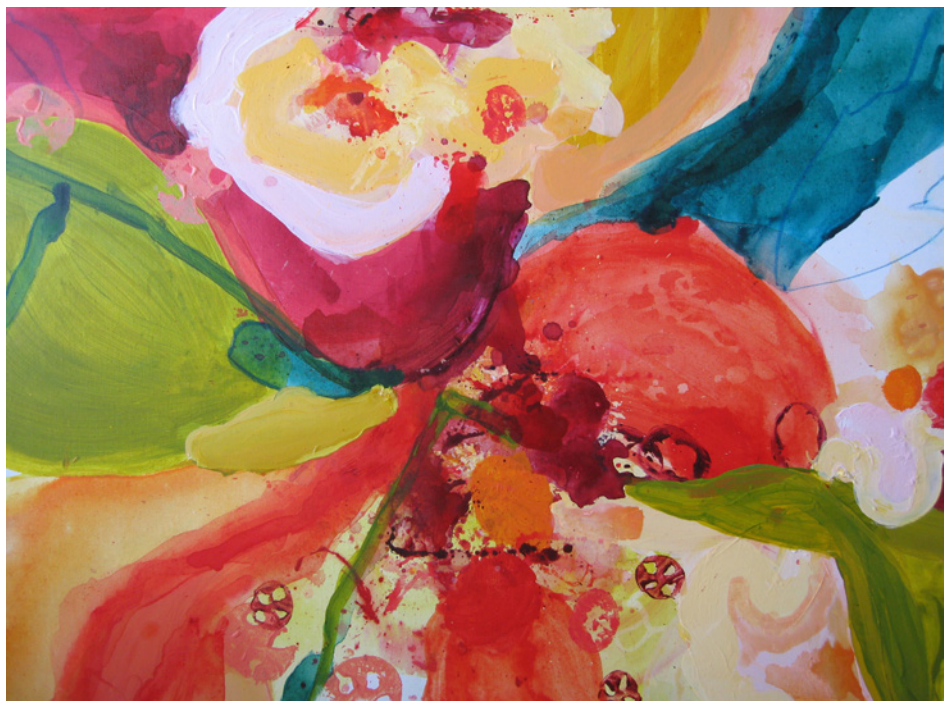
Sorbet Orange 2