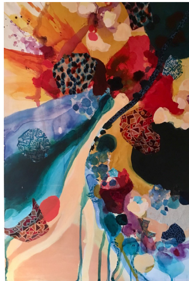
Le Grand Bleu © Anja Hagemann

Dans ce tableau prédominent les couleurs chaudes, voire sombres. Les lignes de force se transforment à certains endroits en lignes de fracture divisant la toile en espaces quasi-indépendants et cependant tous emportés dans le mouvement général des couleurs.