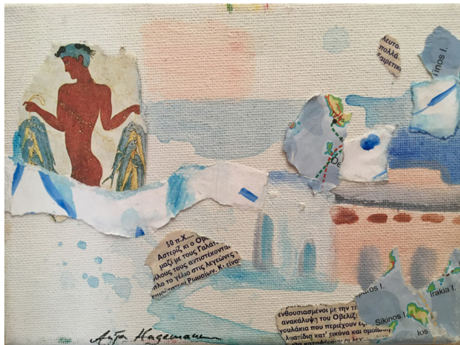
Escapades en Grèce 2 © Anja Hagemann

SÉRIE ESCAPADES EN GRÈCE , 6 tableaux, technique mixte sur toile, 13 x 18 cm, 2007