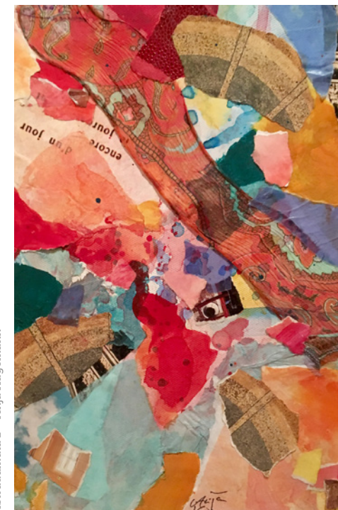
Astradamata 2 © Anja Hagemann