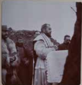
- 1 - La Messe dans les tranchées de 1914. Ligny

Août 1914 : l'engagement des religieux est massif. Membres du clergé séculier et religieux rentrés d'exil s'engagent pendant que de nombreuses religieuses soignent les blessés. L'appel à l'union sacrée reçoit un accueil enthousiaste des catholiques. Pendant toute la guerre, le clergé apportera son soutien moral et spirituel sur le Front, et comptera aussi un grand nombre de morts et de blessés.